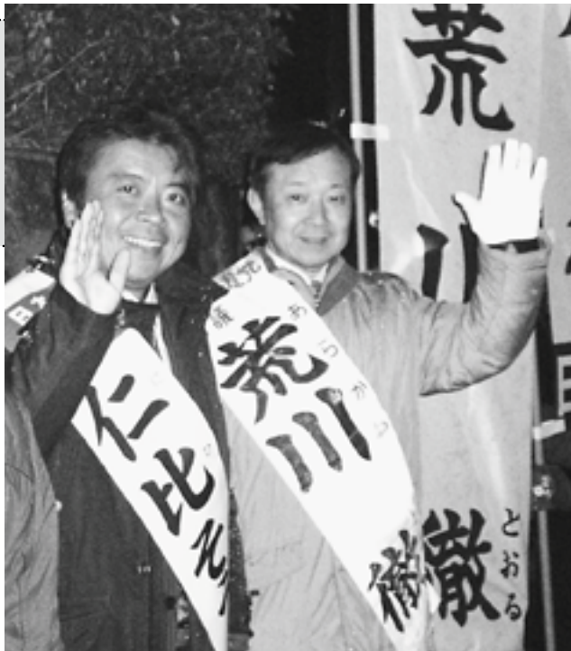
前参議院議員 仁比そうへい