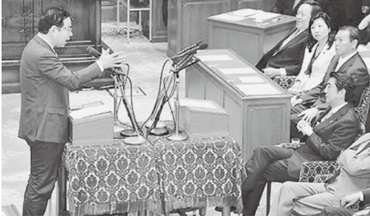
党首討論で安倍晋三首相に質問する志位和夫委員長(左) =20日、衆院第1委員会

安倍晋三首相は、国民の反対世論が広がる前に、一気に「戦争法案」を強行する構えです。戦後70年の今年。戦争か、平和か、日本の進路の重大な分かれ道。「海外で戦争する国」への暴走に、草の根の世論でストップをかけましょう。 「ポツダム宣言」読んでない? 資質が問われています。